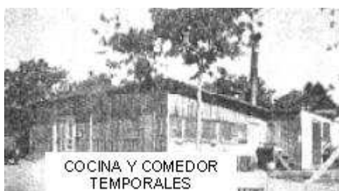
COCINA Y COMEDOR TEMPORALES

Finalmente en el centro del campus, nos encontramos en frente de nuestro comedor temporal,